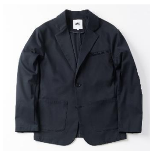
テラードライトジャケット (全6色)17,600円(税込)