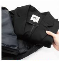
シワになりにくい