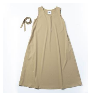
エブリデイワンピース (全6色)14,080円(税込)