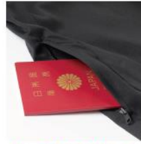
ジップ付きポケット