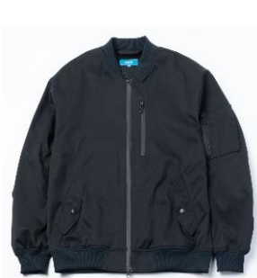
洗えるライト MA-1 (全2色)16,500円(税込)