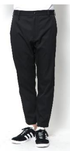
アングルストレートパンツ (全6色)13,200円(税込)